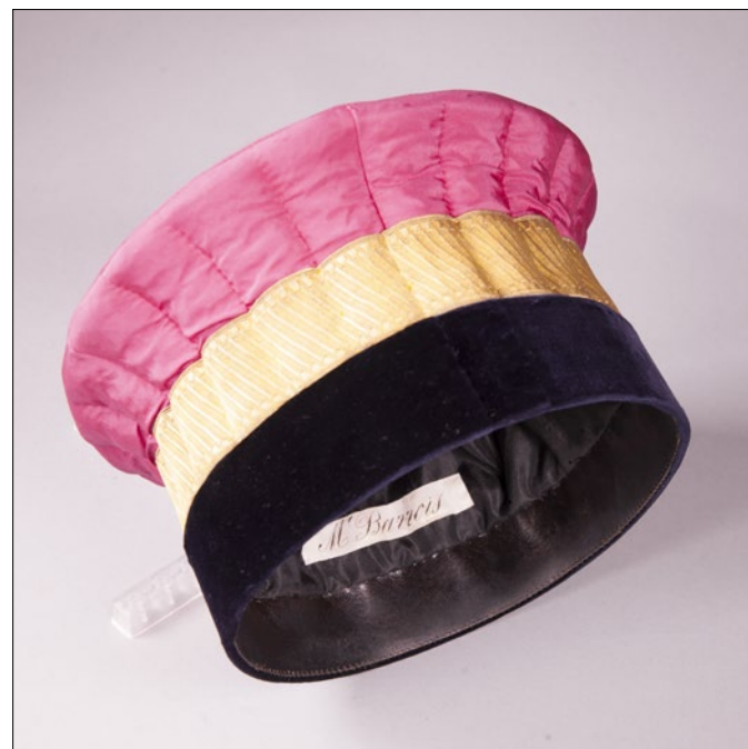
Toque de professeur de Charles Barrois, vers 1900, UMR Évo-Éco-Paléo, bibliothèque recherche choisie pour représenter l'ensemble du corps professoral qui a œuvré avec ardeur au maintien de la vie universitaire

la Faculté des sciences de Lille, ainsi que par les ouvrages, manuscrits, archives, photographies d'époque... conservés à la bibliothèque recherche en paléontologie, à l'Université de Lille – sciences humaines et sociales, au musée d'Histoire naturelle de Lille, dans les services d'archives publics... ■