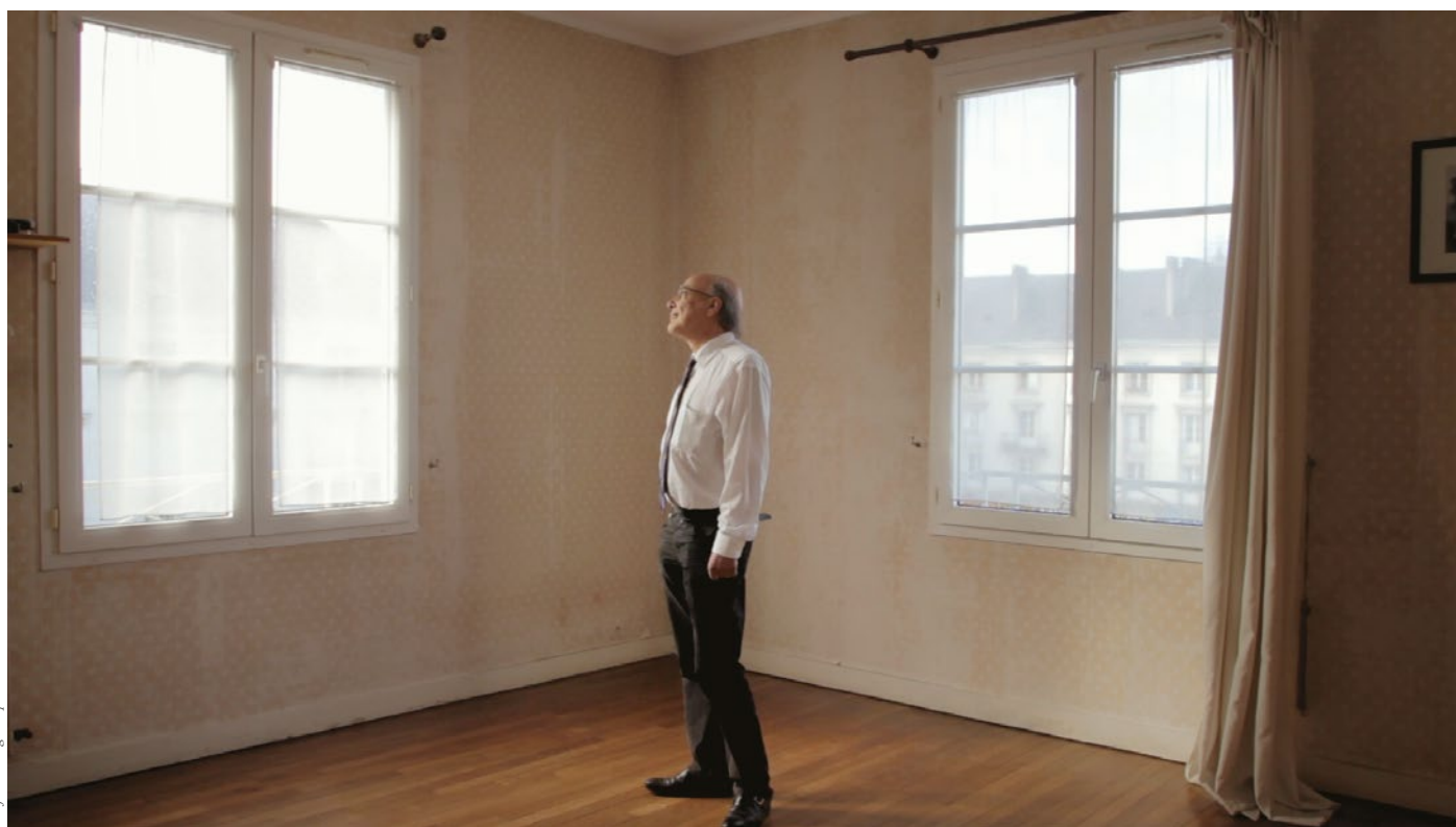
Conjurer l'angoisse par l'énumération © Gwendal Sartre

L'Espace Culture présente cet automne un ensemble de photographies de l'artiste Gwendal Sartre, accompagnées d'un film qu'il a réalisé avec le mathématicien Jean-Paul Allouche, dont il dresse un portrait (voir p. 30).